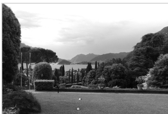
Foto 5 výhľad z Villa Vigoni na Comské jazero