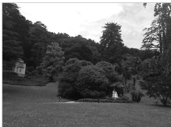
Foto 4 záhrada Villa Vigoni